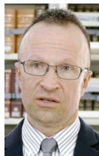
マシュー・バーデルスキー