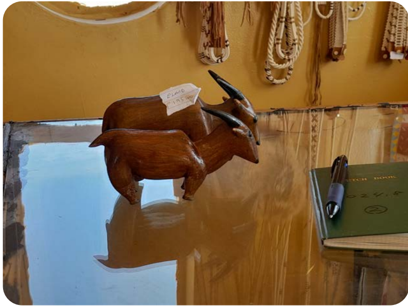
コエンサケネのクラフトショップにて、エランドの置物（2024年8月14日）