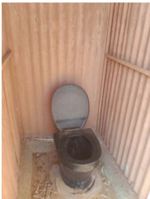
幼稚園に付設されたトイレ。村でのサンテーションの状況についての調査は今後の重要課題の1つである。

ナミビアのナミビア大学、JICA ナミビア・オフィス、在ナミビア日本大使館、オシャナ村、エンドベ村、オナンジョコエ医療博物館、ナミビア国立資料館・図書館などを訪問し、本プロジェクトに関する研究打ち合わせ、資料収集、現地調査などを行った。今回は短期の滞在であり、とくに直近の南部アフリカ滞在（令和6年8月1日から9月6日）においてやり残した基盤研究S「アフリカ狩猟採集民・農牧民のコンタクトゾーンにおける子育ての生態学的未来構築」を推進していくための組織体制づくりに力を入れた。